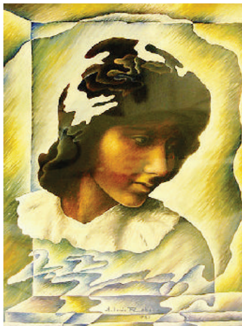
«Rosa Venere» di Antonio Robella In basso a sinistra: «Riflessi nel vento» di Mary Morgillo a destra: «Magia d'autunno» di Isidoro Cottino

Orario: 16-19; festivi 10-12; lunedì chiuso; in esposizione sino al 27 settembre.